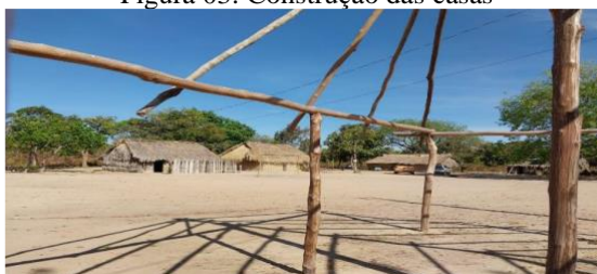
Figura 03: Construção das casas

01 – Observando as casas apresentadas na imagem abaixo, quais são principais formas que você associa com a geometria: